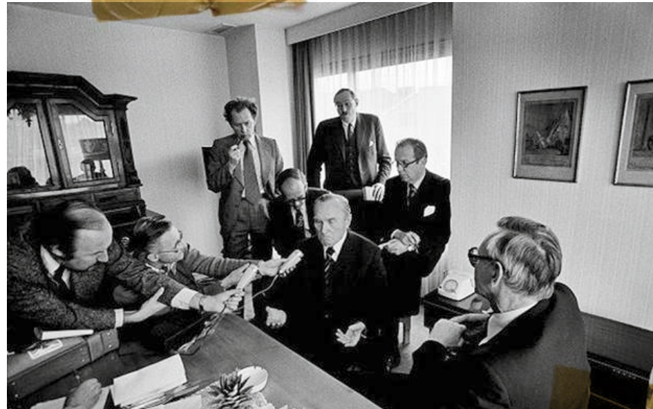
Max van der Stoep en Jan Patočka

handhaven. Dit is wat volgens Havel in een totalitaire dictatuur gebeurt. Men leeft collectief in een leugen, iedereen weet dat, maar het systeem houdt de leugen in stand. Er is maar één manier om hier tegenin te gaan: trouw zijn aan je zelf en aan je eigen opvattingen, en ondanks alles toch de waarheid durven zeggen. Dat is leven in waarheid. Niet de waarheid in pacht hebben, maar er in alle vrijheid en eerlijkheid naar op zoek gaan. Charta 77 was begonnen als een manifest, maar groeide uit tot een grote dissidenten-